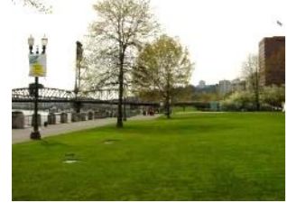
バイパスを廃止して作った リバーフロントの公園