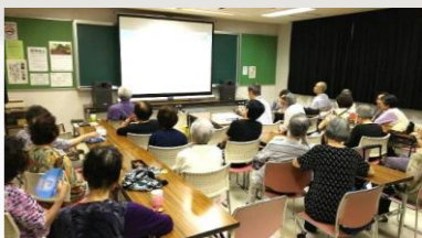
上映前には、映画の時代背景などを簡単に説明があります