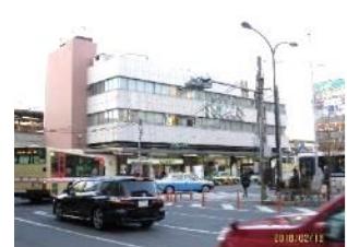
交通利便性が高い中野駅