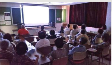
いよいよ上映開始です。100インチの大画面で上映します

それでは 「みやももシアター」を ご期待ください！ さよなら、 さよなら、 さよなら！ (編集委員・才)