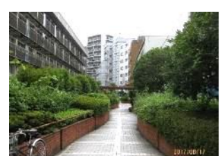
緑の散歩道 (桃園川緑道)