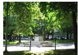
市民の地元愛と活動が 緑豊かなまちを育ててきた ポートランド市

オレゴン州のポートランド市をご存知でしょうか？「住んでみたい都市」として、アメリカ国内はもとより世界的に注目を集めています。同市は20世紀中ごろの行き過ぎた開発を反省し、住みやすく歩いて楽しいまちを目標に掲げてきました。地元の人たちの愛情とまちづくり活動への情熱が環境や快適な暮らしを大切に作る都市を育てたのです。